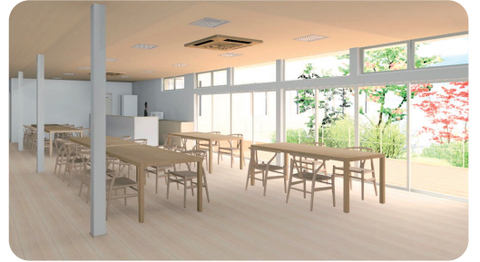
開放感あふれるラウンジ(食堂)